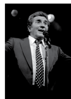
Genève 1991